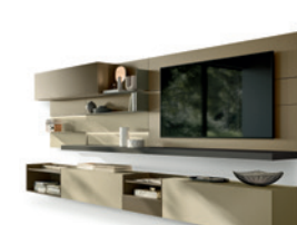
Agio P. 116