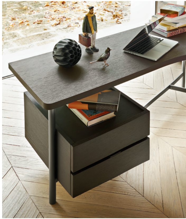
L/W 1350 x H 741 x P/D 475/687 L/W 1500 x H 741 x P/D 475/687

In queste immagini, lo scrittoio Desk con piano sagomato impiallacciato in Rovere Grigio è abbinato a una cassettera sospesa nella stessa finitura. Entrambi sono disponibili in materico, laccato opaco, laccato lucido o legno impiallacciato. La struttura in metallo è in finitura Piombo.