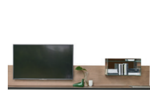
Super P. 210