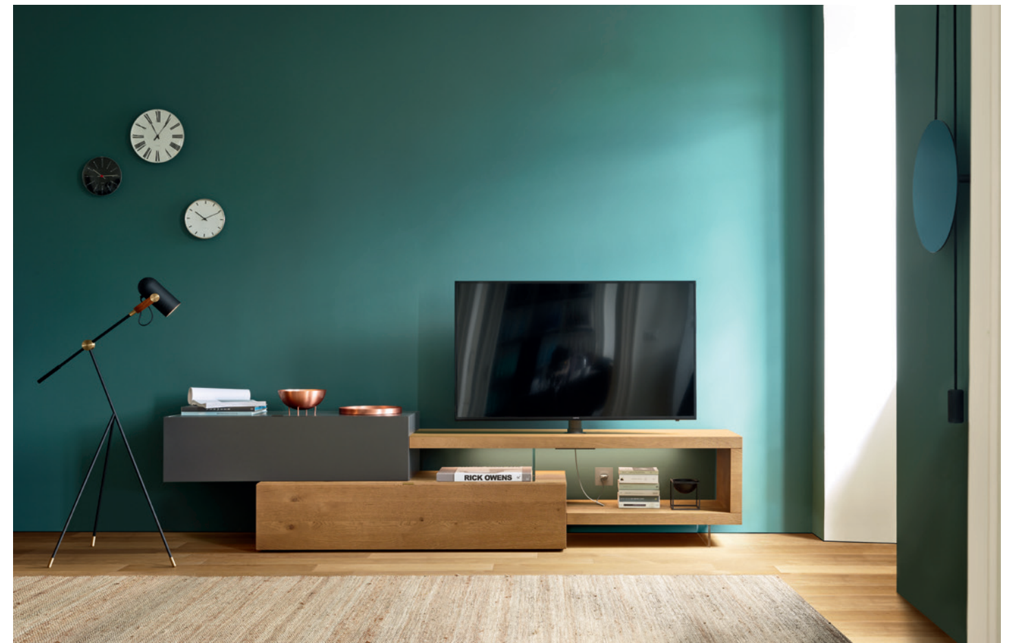
L7C69 - L/W 2850 x H 1600 x P/D 352/546