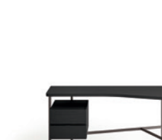
Scrivanìa Desk P. 264