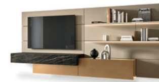
Boiserie TV P. 198