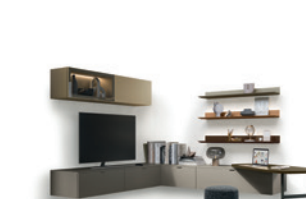
Scrittoio Girevole P. 258