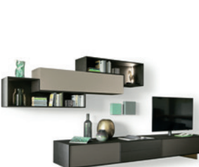
Riquadri P. 146