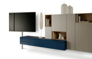
Video P. 206