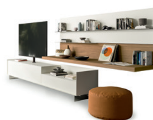
Cabaret Step P. 34