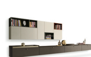
Open P. 106