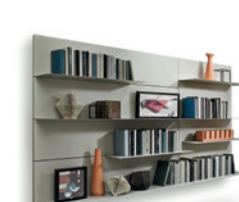
Mensole per Boiserie P. 228