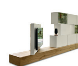
Roto P. 216