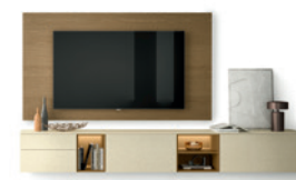
Pannello TV P. 190