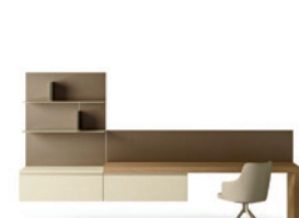
Pianali SP60 P. 247