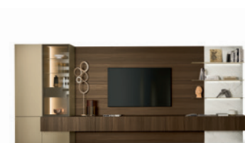
Boiserie P. 64