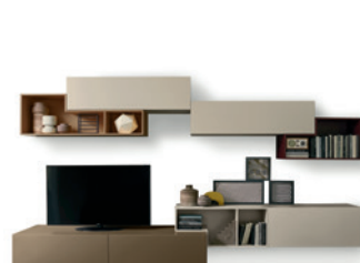
Tetris P. 136