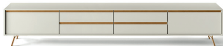
L7C46 - L/W 2430 x H 500 x P/D 561