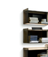
Mensole Domino P. 241