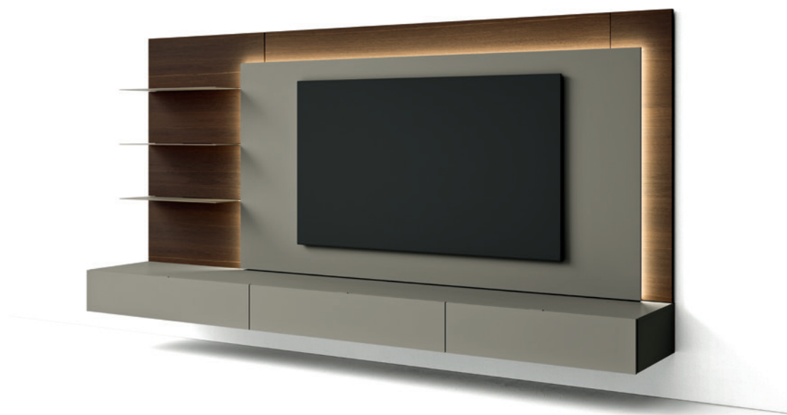
L7C65 - L/W 3000 x H 1680 x P/D 289/546