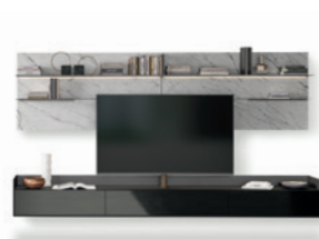
Cabaret One P. 06