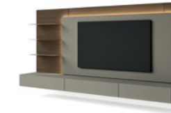
Ciak P. 200