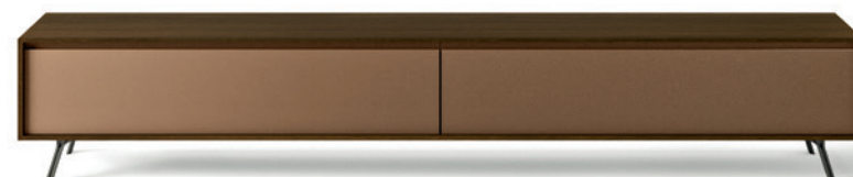
L7C46 - L/W 2430 x H 500 x P/D 561