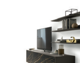
Mensole Super P. 236